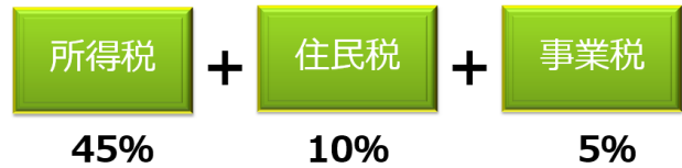
【表 所得税の税率表】

不動産賃貸業であっても、5棟 10室以上を賃貸していると事業的規模となれば、事業税 5%が課されます。